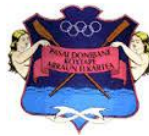
SAN JUAN- SUMELEC